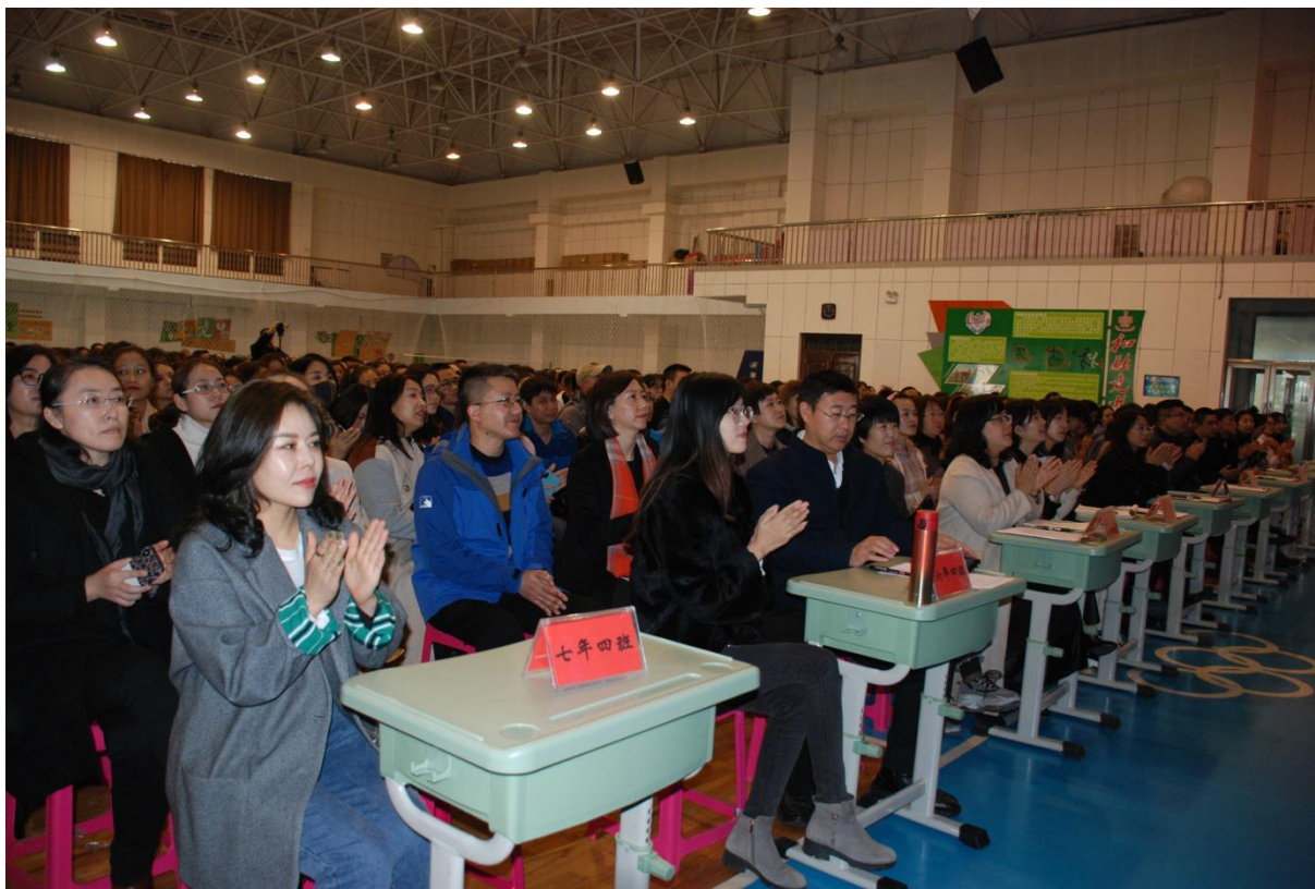
领导的发言得到了家长们的认可

“人文素养家校共育共治”实践家长专题讲座紧紧围绕家庭教育的重要性，处处彰显家长影响的长久性，时时体现心灵成长的深远性。它必然会摇动家长的灵魂，推动家庭的成长，与倾情、全情、尽情于教书育人的学校、教师形成合力，唤醒孩子的心灵。