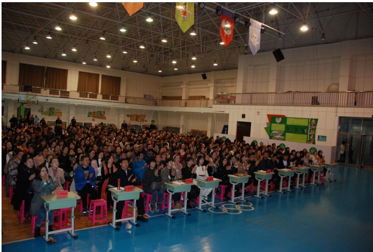
全体实验班家长认真学习

靓湖学校的“精雅教育”致力于让每个孩子找到适合他发展的平台； 让每个孩子更自由；让每个孩子的人生更幸福。这也恰恰是“人文”课题 要实现的最终目标——呵护生命、饱满生命、茁壮生命、绽放生命。